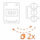
2 medios distintos