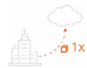
Una copia en 1 lugar físico distinto.