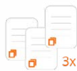
3 copias del dato

La regla 3-2-1 es un método sencillo de recordar y eficaz la hora de realizar las copias de seguridad, que Nologin aplica al diseño de sus infraestructuras.